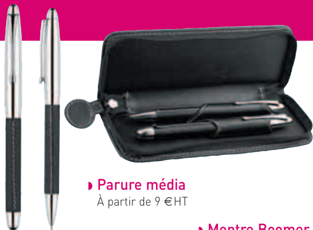
► Parure média À partir de 9 €HT

Filiale à 100 % du Club, PSG Merchandising est l'ayant-droit exclusif de la marque Paris Saint-Germain pour tout le merchandising et gère également les réseaux de vente officiels du Club. Notre marque est ainsi référencée dans de nombreux réseaux de distribution à travers toute la France.