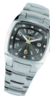
► Montre SDN À partir de 42 €HT