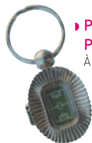
► Porte-clés Parc des Princes À partir de 4,25 €HT