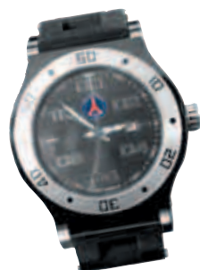
► Montre Boomer PSG À partir de 32 €HT

Plus qu'un club de football, le Paris Saint-Germain est aujourd'hui une véritable marque à part entière dont la notoriété dépasse largement nos frontières.