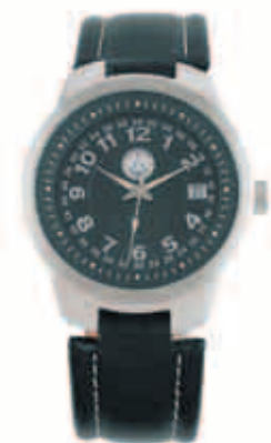
► Montre Flight PSG À partir de 24,50 €HT