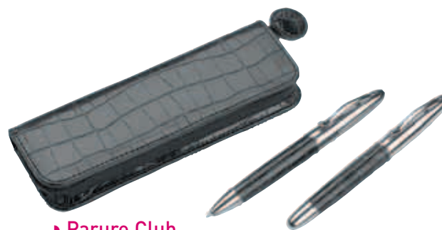
► Parure Club À partir de 13,20 €HT