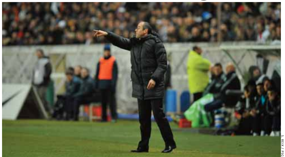
Au Parc des Princes, Paul Le Guen incite ses joueurs à aller de l'avant : résultats probants depuis le début de l'année 2009, avec 4 victoires sur 4 et 2 buts inscrits par rencontre.

Nous avons gagné quelques matches depuis. On a avancé au classement, cela donne