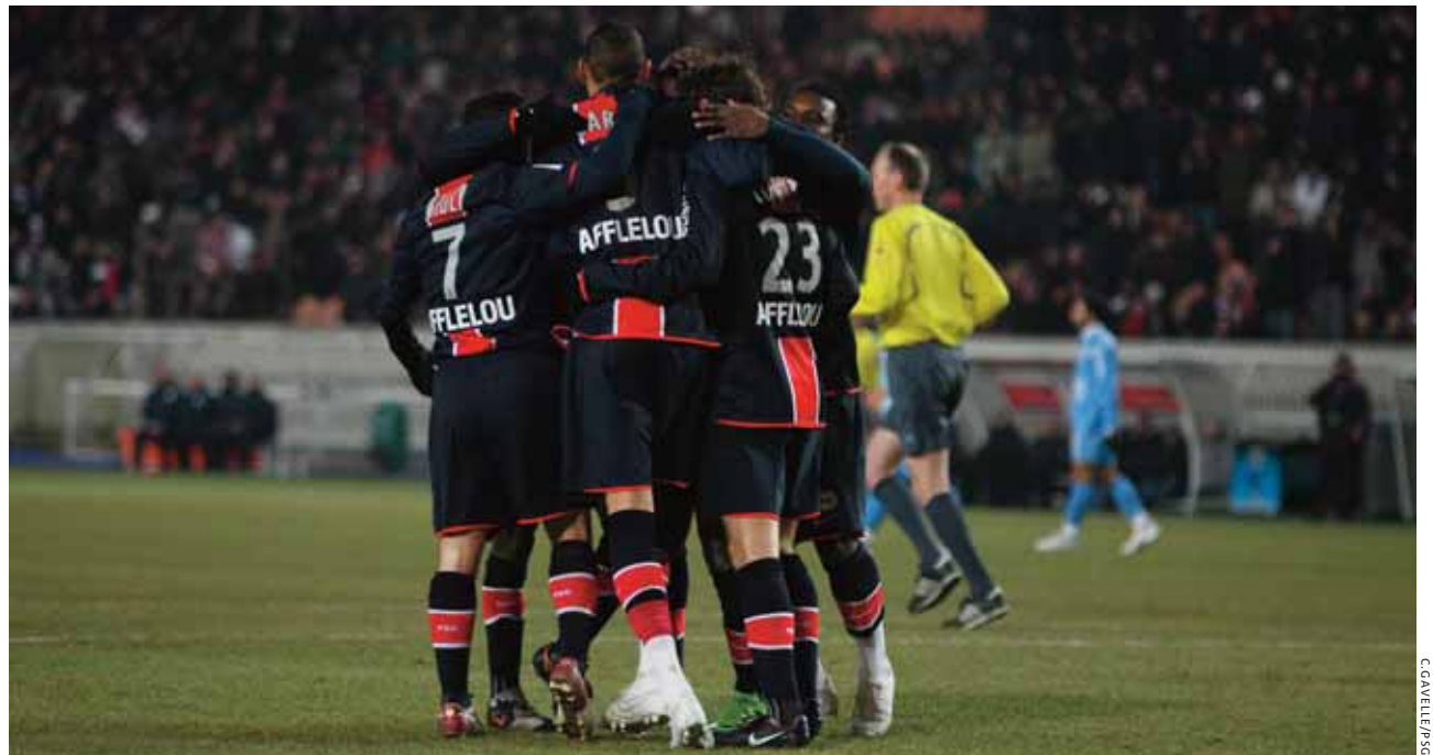
Victoires contre Sochaux (2-1) et Caen (2-0) : le Paris Saint-Germain a fait le plein de points au Parc depuis le début de l'année. Jamais 2 sans 3 contre les Stéphanois ?

la brillante victoire des Parisiens en terre nantaise, le week-end dernier. Même privés de Guillaume Hoarau (blessé), les joueurs de Paul Le Guen ont fait exploser la défense des Canaris, Sessegnon et Rothen ouvrant des brèches dont ont parfaitement su profiter le duo d'attaque Giuly-Luyindula. Revenus à égalité avec Bordeaux (42 points), les Parisiens peuvent désormais ambition-