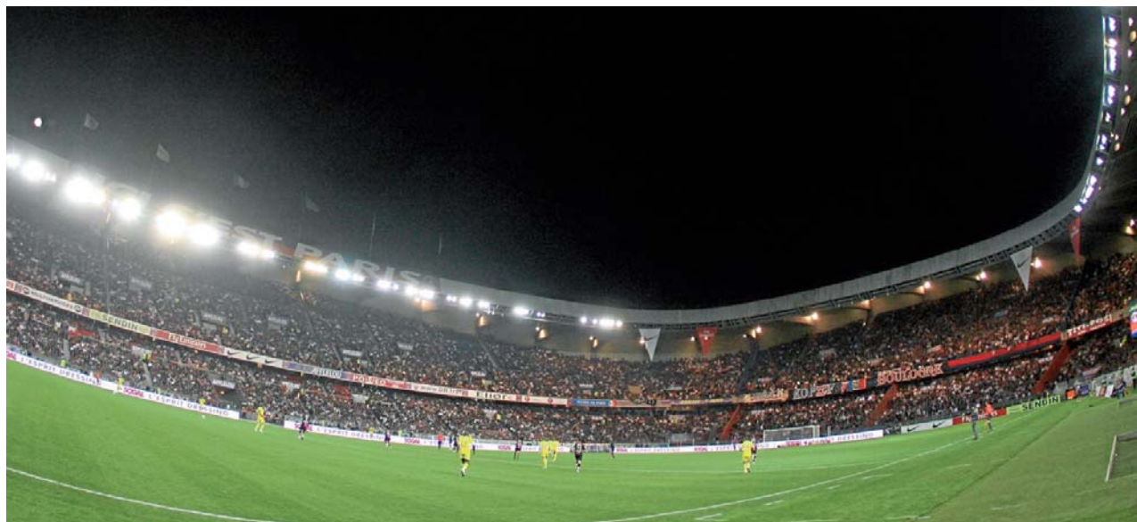
Plus de 120 000 spectateurs pour les 3 premiers matches de Championnat : le Parc des Princes fait le plein cette saison.

Et la réception des Bretons pourrait paraître l'occasion idéale. Les Lorientais, en panne de confiance, n'ont plus gagné depuis le 9 août et un succès au Mans, lors de la 1 ère journée. Installés dans la zone rouge, ils pointent aujourd'hui à